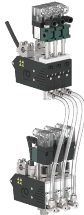
Areo liefert präzisen, wiederholgenauen Kringelauftrag mit exakter Randgenauigkeit