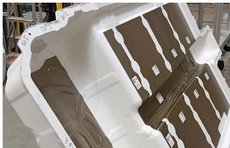
Unterschiedlich grosse Mica-Platten können trotz variabler Klebstoffauftragsmenge mit Aero ohne Düsenwechsel verklebt werden.